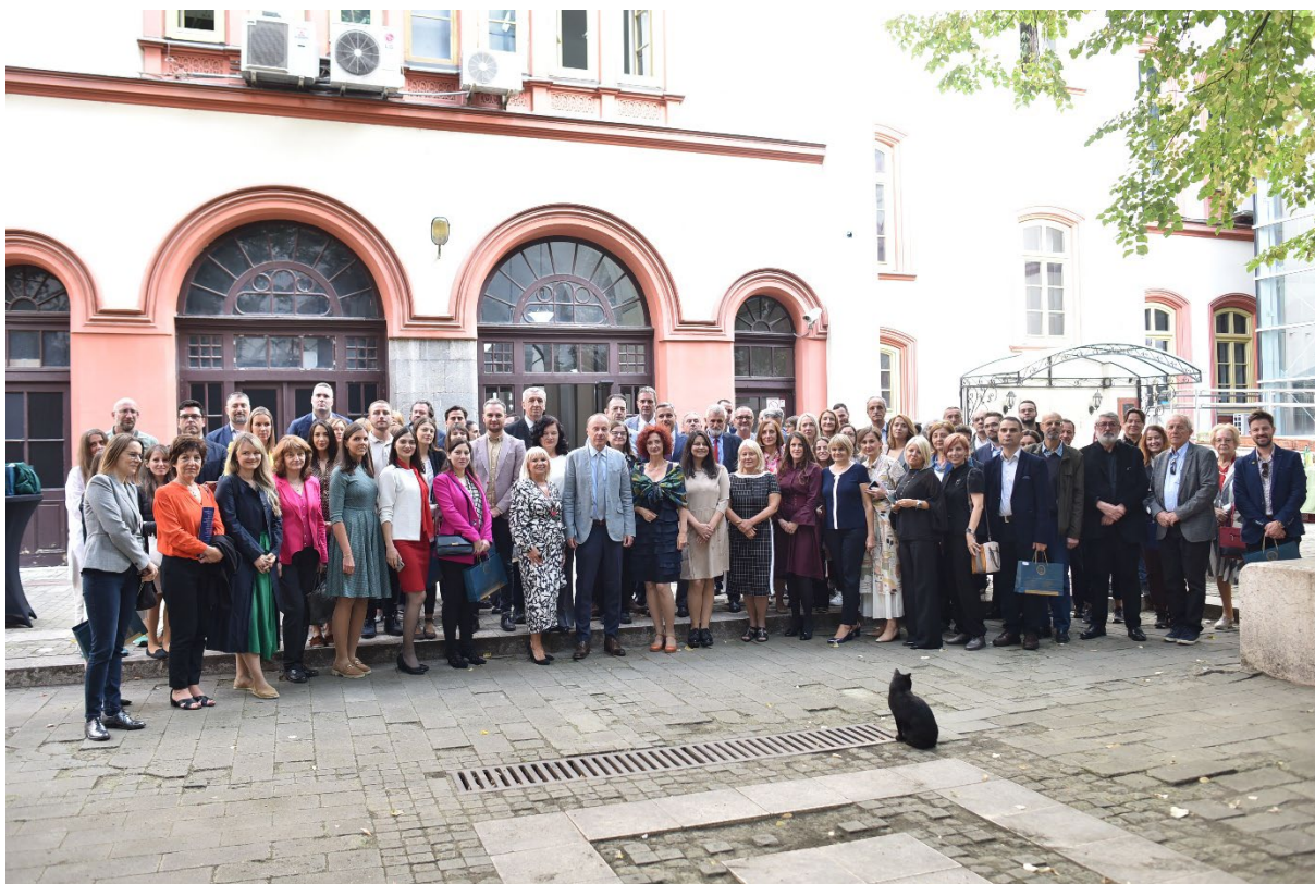
групна фотографија у атријуму Капетан Мишиног здања